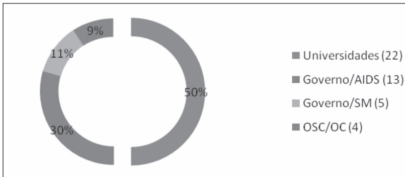
Gráfico 1: Instituições de origem dos trabalhos analisados.

Dos trabalhos selecionados, 50% eram oriundos de universidades, 41% de instituições públicas (30% ligadas às políticas de prevenção/control de doenças transmissíveis em geral e de HIV/Aids em particular e 11% ligadas às políticas de saúde mental) e 9% advinham de associações, redes e organizações da sociedade civil (gráfico 1). Observa-se que no Brasil há uma crescente assimilação da RD pelo poder público, inicialmente como uma estratégia efetiva no campo das doenças transmissíveis e, nos últimos anos, se expandindo como modelo de política para o campo da saúde mental.